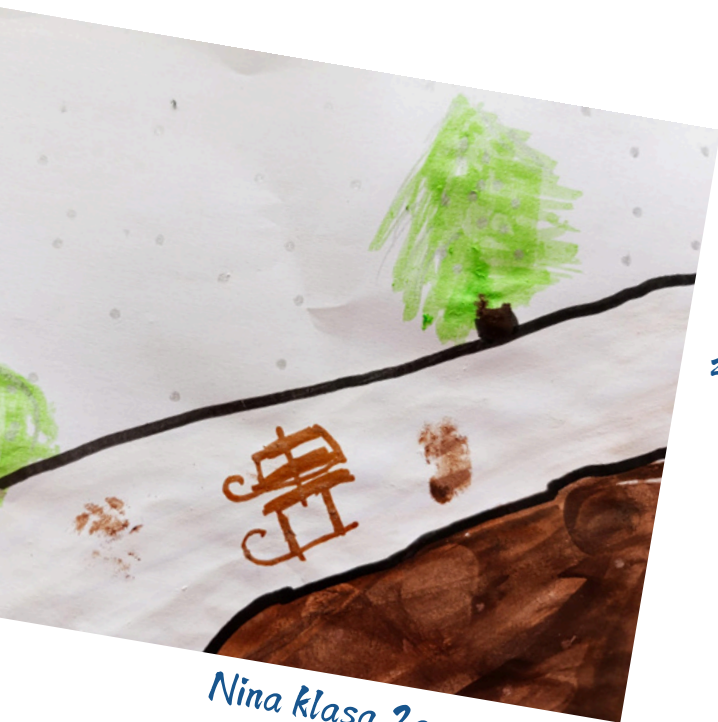
Nina klasa 2a